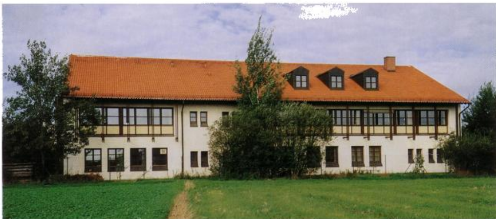
Sicht von Osten